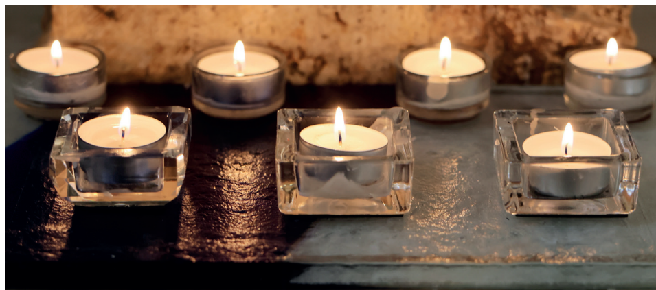
In der Gebets- und Kerzenecke der Stadtkirche bringen viele Menschen ihre Sorgen in der Stille vor Gott.

In der Stadtkirche nehmen die Pfarrer immer wieder andere Segenslieder. „Wir sind nicht auf eines festgelegt“, sagt