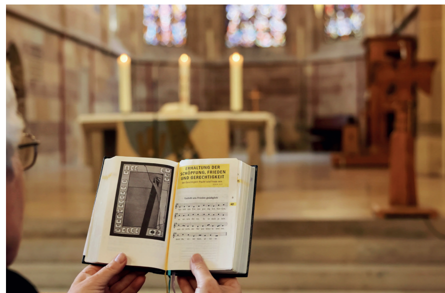
In der Stadtkirche wird auch das Lied 421 aufgeschlagen.